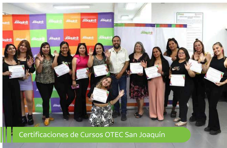
Certificaciones de Cursos OTEC San Joaquín