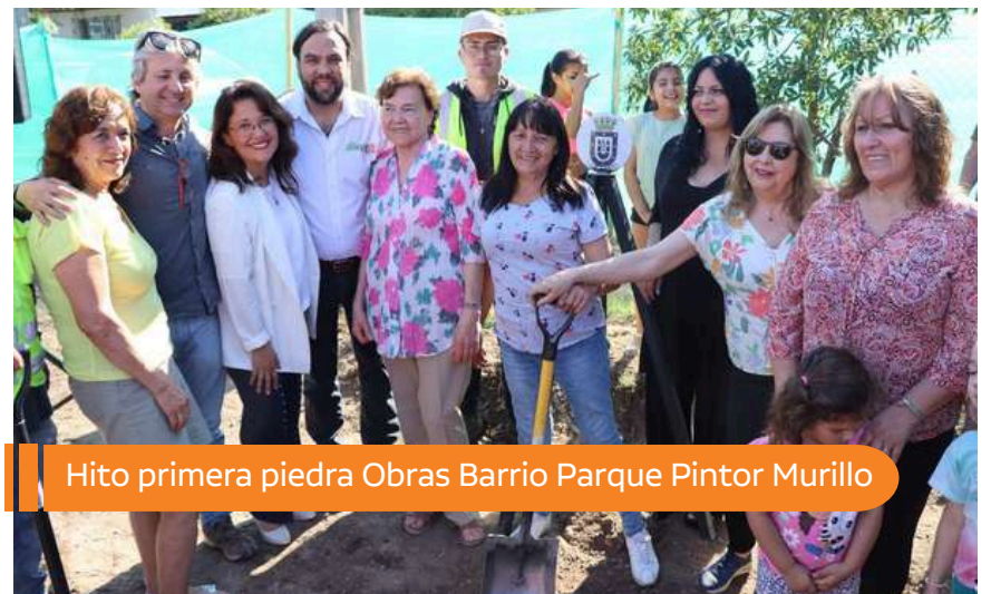
Hito primera piedra Obras Barrio Parque Pintor Murillo

Ambas iniciativas van en directo beneficio de las agrupaciones, quienes contarán con mejores instalaciones para realizar actividades en comunidad.