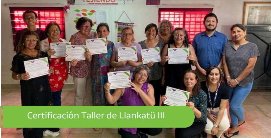
Certificación Taller de Llankatü III