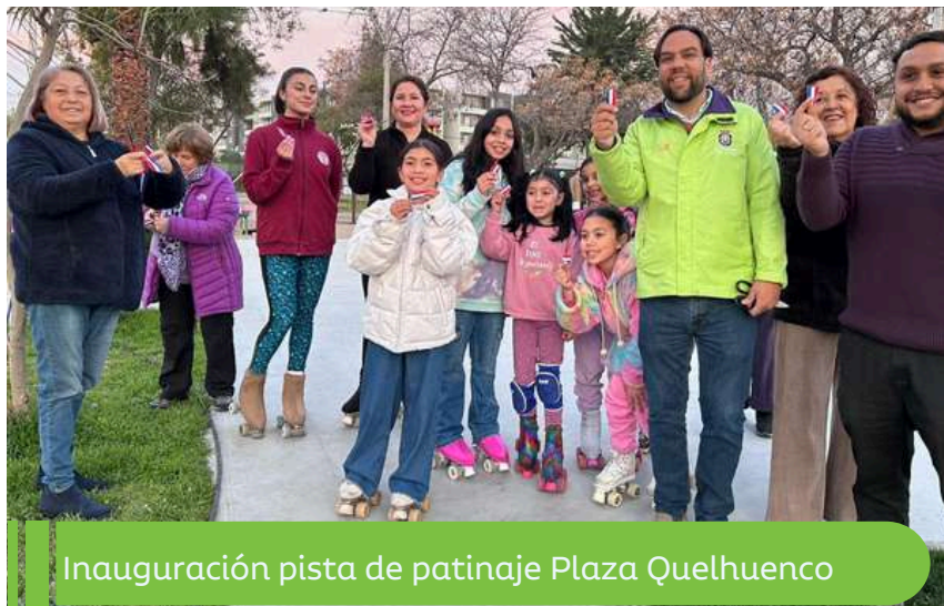
Inauguración pista de patinaje Plaza Quelhuenco

En cuanto a la implementación de espacios deportivos, en septiembre inauguramos una nueva pista de patinaje en Plaza Quelhuenco , un proyecto financiado por el municipio que contempló una intervención de 211 m2 para el desarrollo de deportes como patinaje.