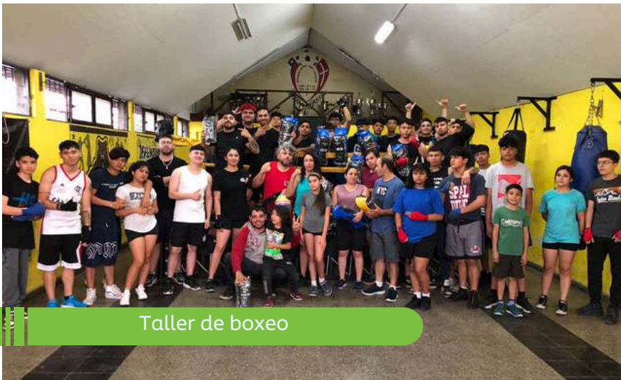
Taller de boxeo

Durante este año, nuestra Corporación de Deportes continúa promoviendo actividades en pos de una comuna más activa y comprometida con el deporte. En el transcurso del año 2024, ofrecimos más de 200 talleres con cerca de 6.000 participantes , quienes formaron parte de talleres como fútbol, basquetbol, zumba, voleibol, boxeo ¡Y muchos más!