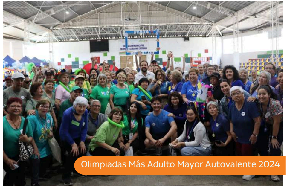
Olimpiadas Más Adulto Mayor Autovalente 2024