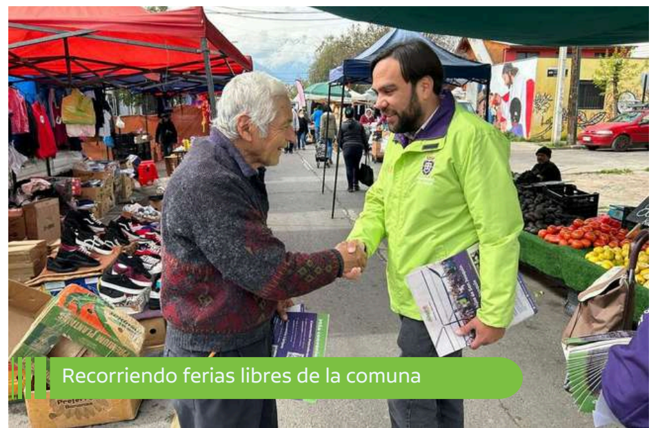
Recorriendo ferias libres de la comuna