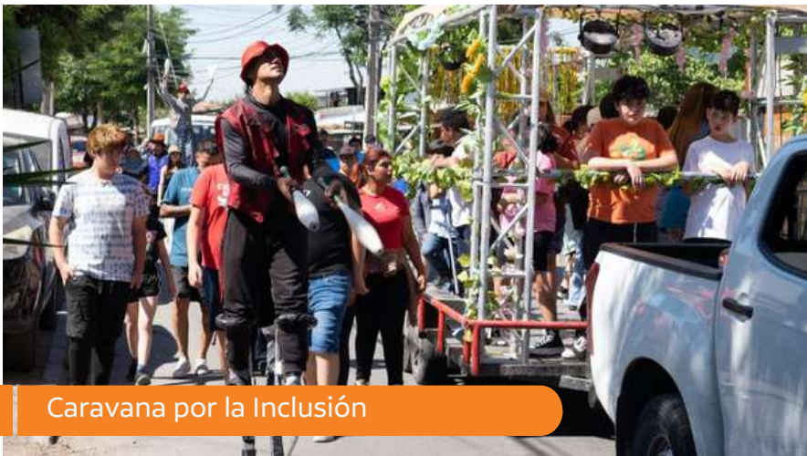
Caravana por la Inclusión

Cada martes a través del Programa Gobierno Comunal en tu Barrio, llevamos nuestros servicios municipales como Registro Social de Hogares, asistencia social y más, a distintos puntos de la comuna, acercando soluciones directamente a la comunidad.