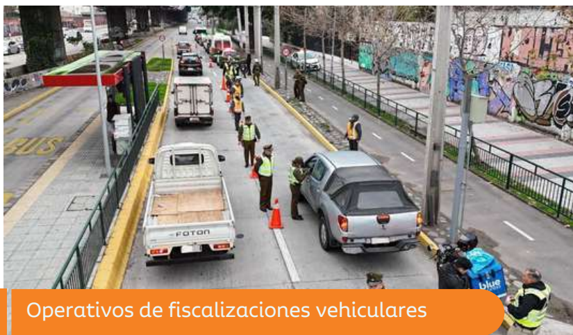
Operativos de fiscalizaciones vehiculares

Estas iniciativas se suma a una serie de acciones que como municipio hemos impulsado para fortalecer y fomentar la seguridad, donde se incluye la renovación de la flota de vehículos de seguridad, el aumento de guardias municipales patrullajes preventivos y puntos fijos, la instalación de alarmas comunitarias en conjunto con Juntas de Vecinos, entre otras medidas.