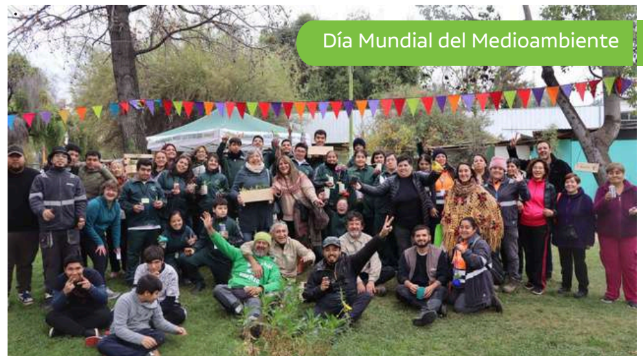
Día Mundial del Medioambiente

Por otro lado, nuestra Clínica Veterinaria, continúa atendiendo a los animales de la comuna, mediante operativos con servicios de implantación de microchip, vacunaciones, además control de parásitos, entre otros procedimientos.