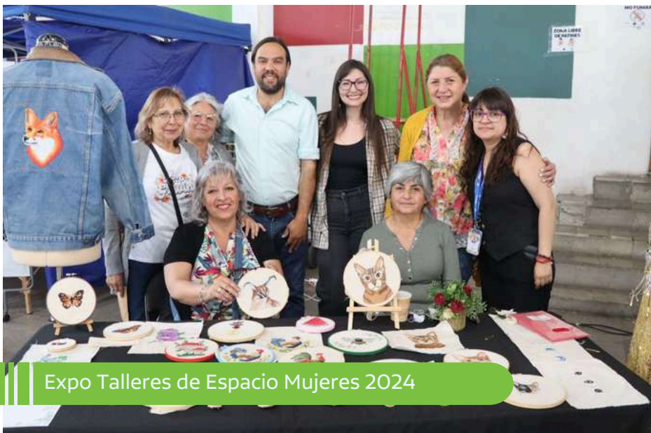
Expo Talleres de Espacio Mujeres 2024