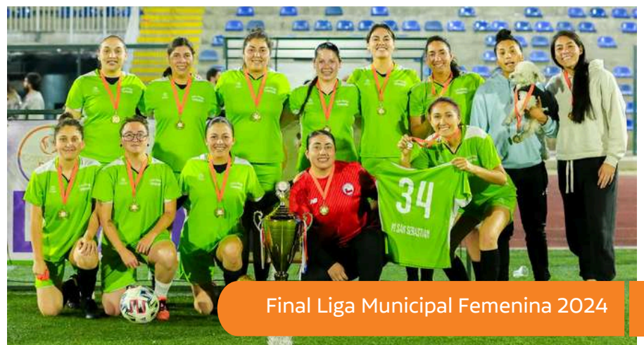
Final Liga Municipal Femenina 2024

El torneo no solo destacó por el nivel competitivo de las cerca de 200 jugadoras que participaron activamente en los partidos, sino también por la gran visibilización que se dio al fútbol femenino, demostrando un futuro prometedor para esta disciplina .