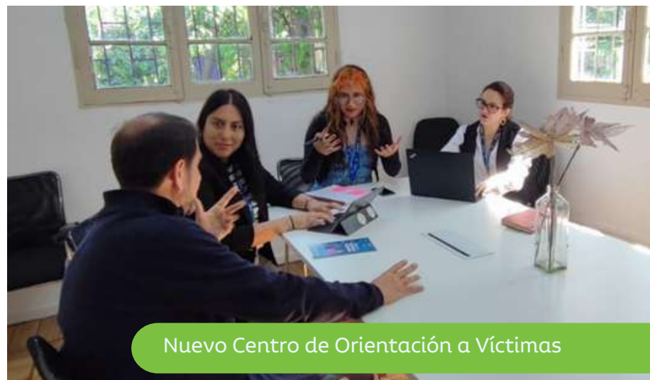
Nuevo Centro de Orientación a Víctimas

De esta forma y gracias a la orden de la Fiscalía Nacional, el inmueble pasó a una etapa de transición, para finalmente convertirse en un recinto municipal enfocado en la prevención del consumo de sustancias ilícitas.