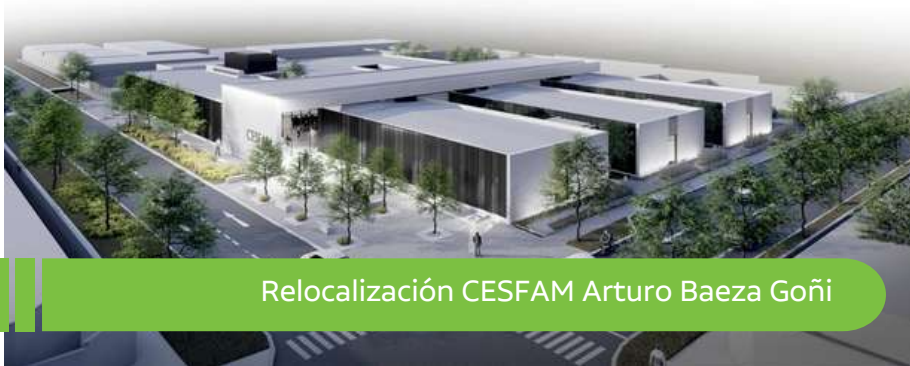
Relocalización CESFAM Arturo Baeza Goñi

A esto se suma la construcción del nuevo CECOSF Schubert , una iniciativa que busca descongestionar el flujo de personas que se atiende en el CESFAM San Joaquín , y de esta forma brindar una mejor atención a la comunidad que se atenderá en los centros de salud.