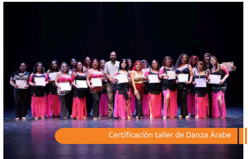
Certificación taller de Danza Árabe