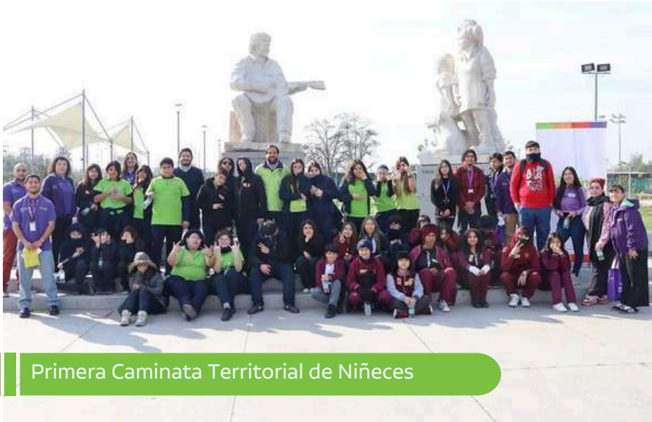
Primera Caminata Territorial de Niñeces